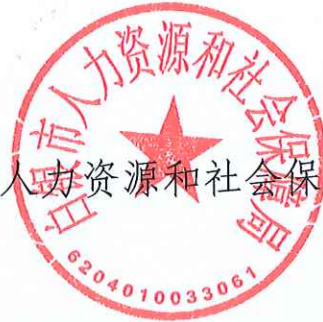
白银市人力资源和社会保障局