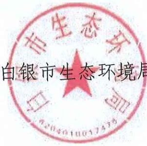
白银市生态环境局