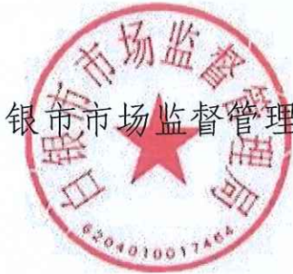
白银市市场监督管理局