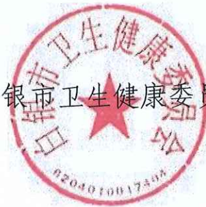
白银市卫生健康委员会