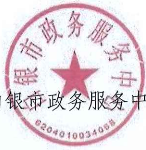
白银市政务服务中心