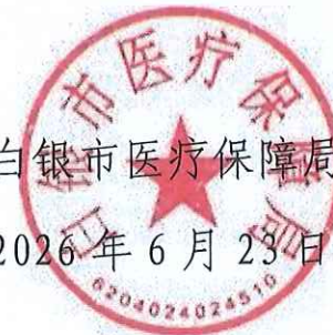
白银市医疗保障局