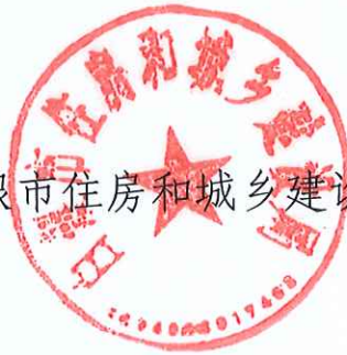
白银市住房和城乡建设局